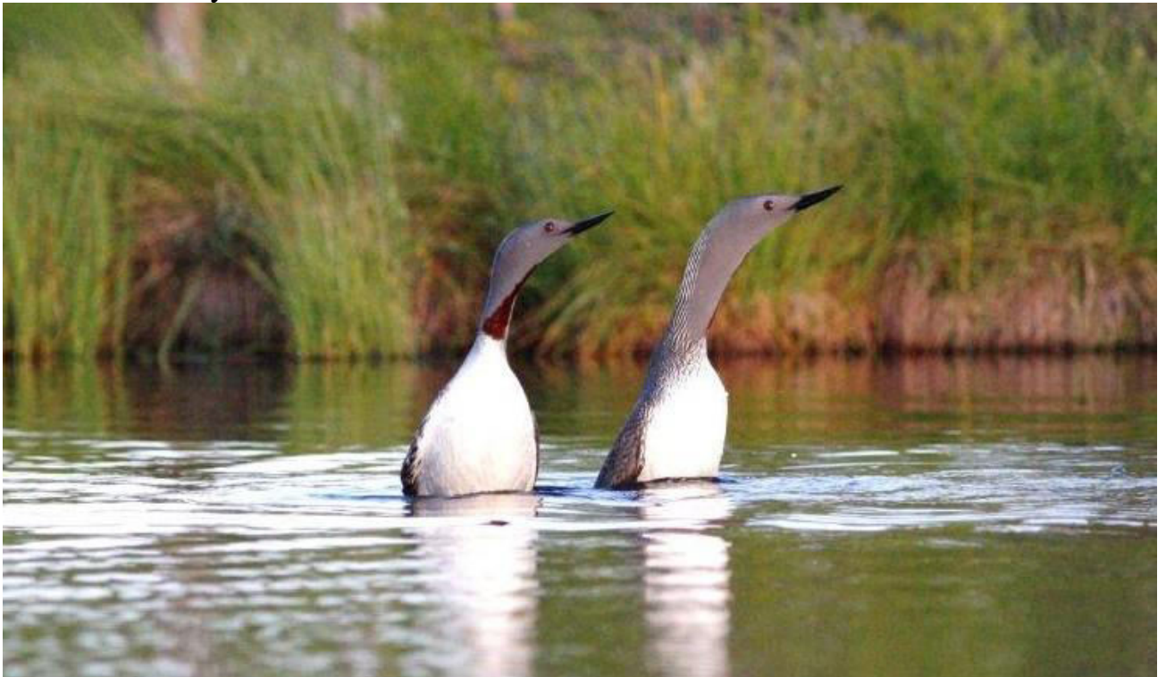
Smålommspar vid Knuthöjds mossen.

Knuthöjds mossen är en fantastisk biotop med alla sina små gölar och gyttjiga myrdrag. En verklig karaktärsart bland fåglarna är en vackra och fascinerande smålommen . Från de utmärkta träspångerna kan man på närhåll beskåda lommarna när de ruvar sina ägg i kanten av en göl eller noga vakar över de få ungarna (En eller två små duniga telningar brukar det vara). Denna gång såg vi inte till några nykläckta ungar, men ett par stycken av de 10 vuxna smålommarna vi såg låg och ruvade. Knipan och krickan hade däremot fått ut ungar! Små dumbollar som kajkade omkring och plockade i sig föda under mammans beskydd.