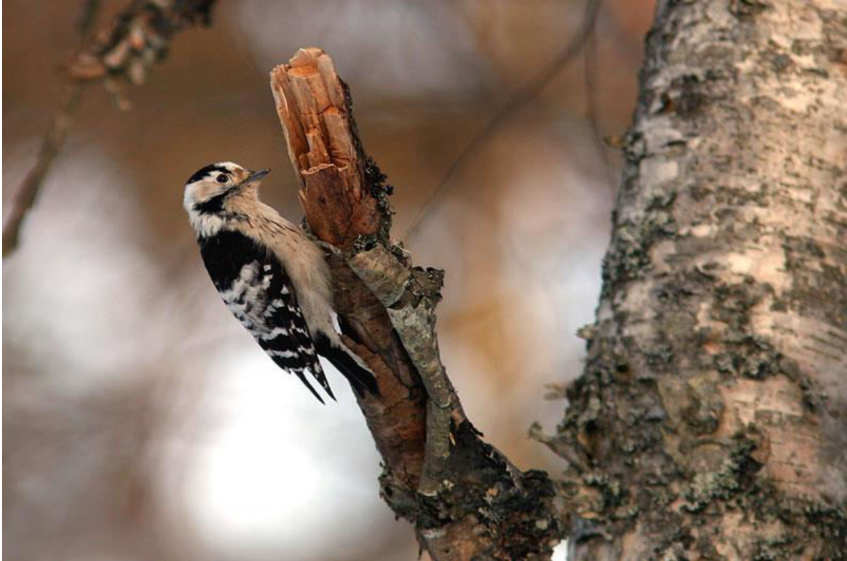
Hona av mindre hackspett.