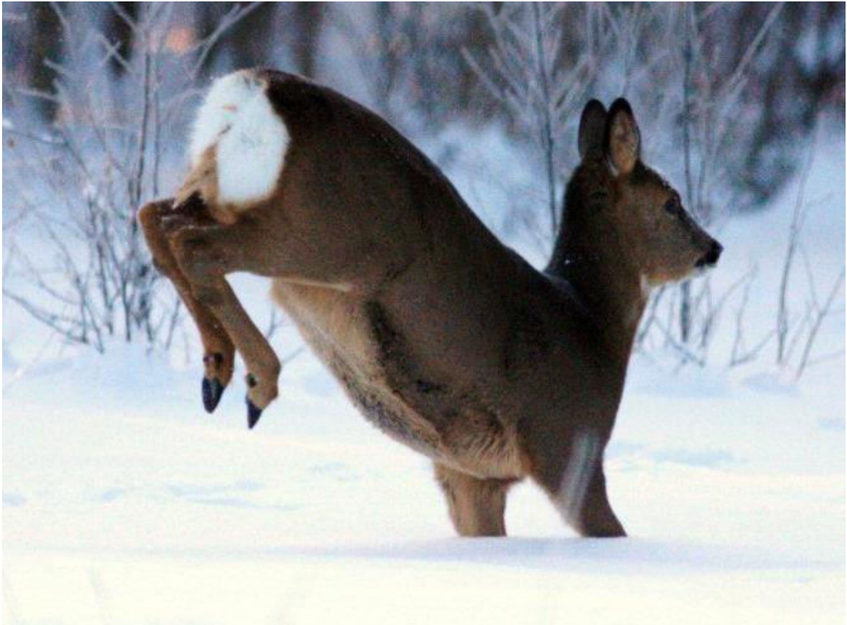
Rådjur kan vara ett av många bytesdjur till ”de stora”.