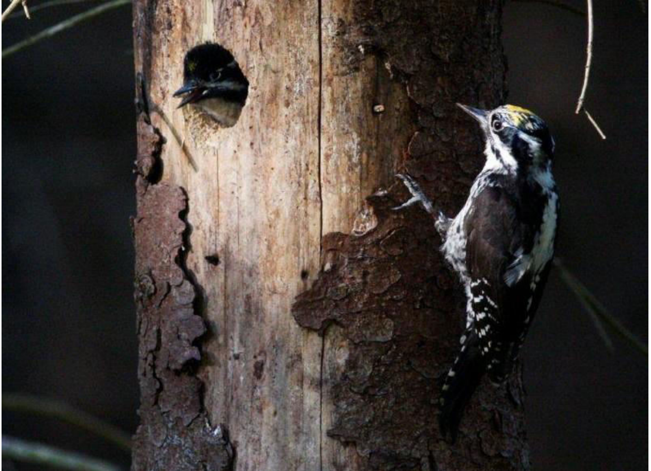
Tretåig hackspett vid boet nära Pershyttan.