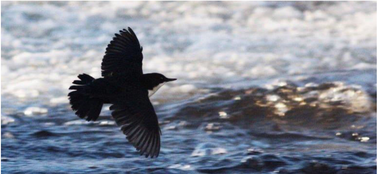
Strömstare vid häckningen i Järle kvarn

En konstaterad häckning: Järle kvarn med ett okänt antal ungar. Ej rapporterad mellan 31.5-3.10.