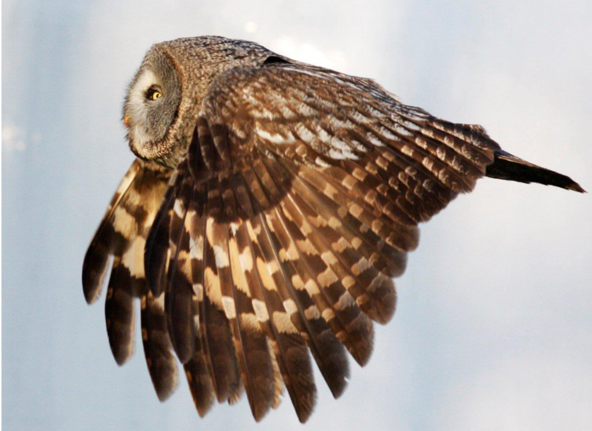
Lappugglan norr om Lindesby.