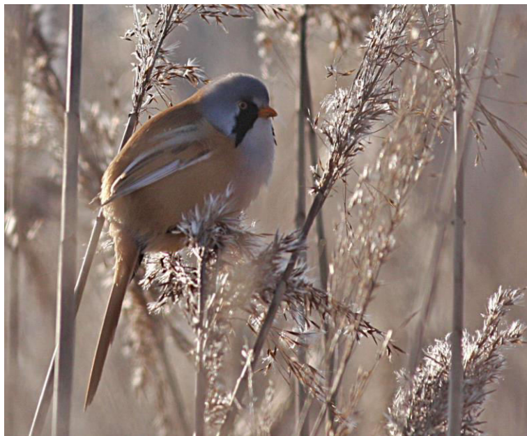
Skägges blev ny i Nora kommun år 2008, medan snatterand och rördrom blev nya år 2009. Foto taget på Getterön, Varberg: Joakim Johansson

Fågelåret: Under 2009 observerades sammanlagt 186 fågelarter, vilket är ganska normalt. Två helt nya arter noterades. Det började med en snatterand som upptäcktes i Åsbosjön den 31 mars. Den flög sedan iväg och landade i Lillsjön vid Gyttop. Den andra helt nya arten blev de båda rördrommarna som var uppe och flög vid Åsbosjöns vassrika åmynning. Fåglarna upptäcktes på föreningens cykelexkursion runt Åsbosjön den 17 maj. Hittills har det sammanlagt noterats 242 fågelarter i Nora kommun.