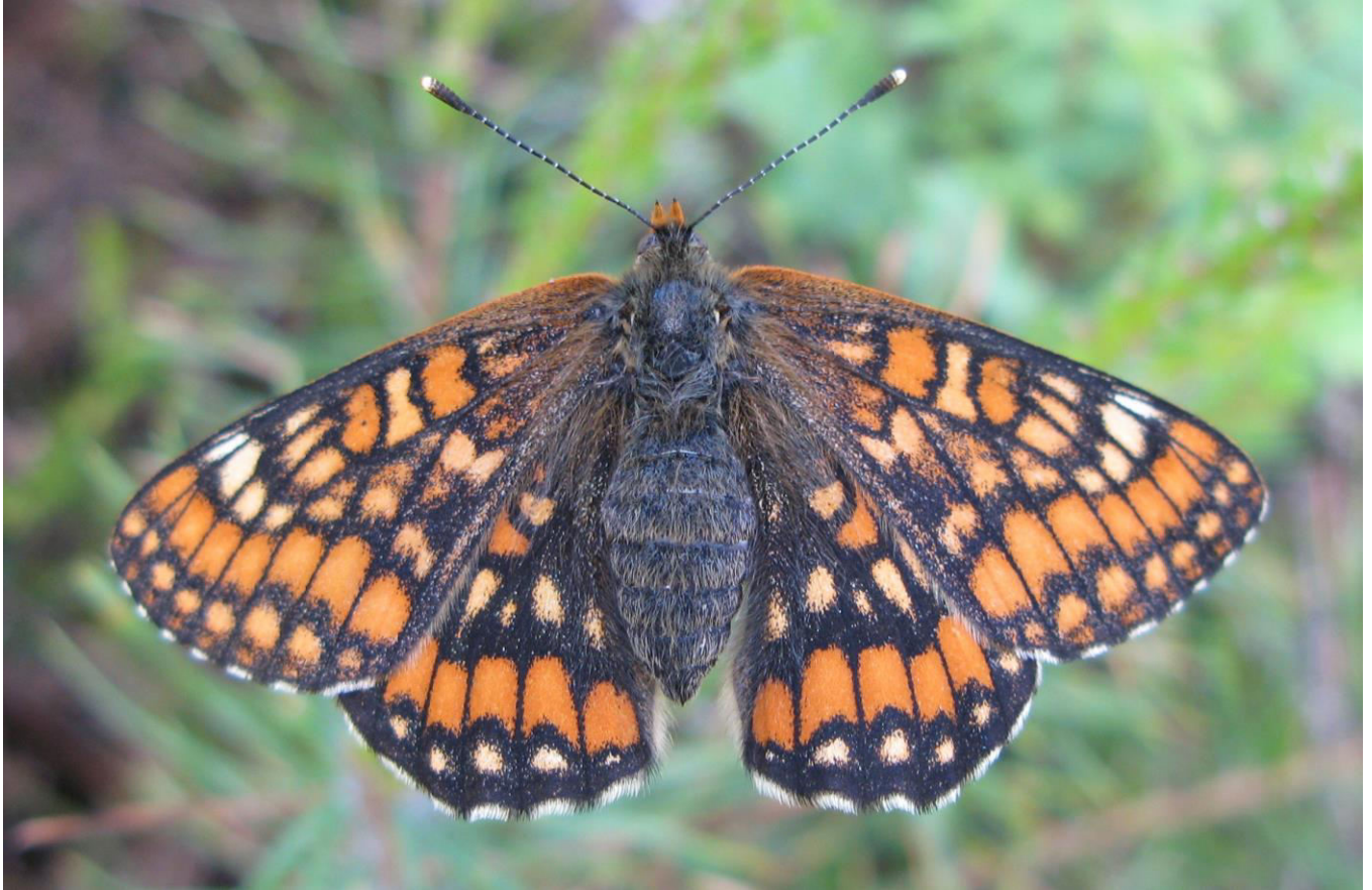
Den vackra och starkt hotade asknätfjärilen vid Munkhyttan.

Tibasten var ganska vanlig liksom tvåblad och blåsippor . De senare hade ju naturligtvis blommat ut för länge sedan. Slätterfibblan denna ståtliga men numer sällsynta växt, finns fortfarande kvar och i slutningen växte skogsvial . Två andra ärtväxter som är ovanliga och värda att nämna är backvial och vippärt . Alla var mycket nöjda med denna kväll och vi hoppas på fler exkursioner med Claes och Kjell.