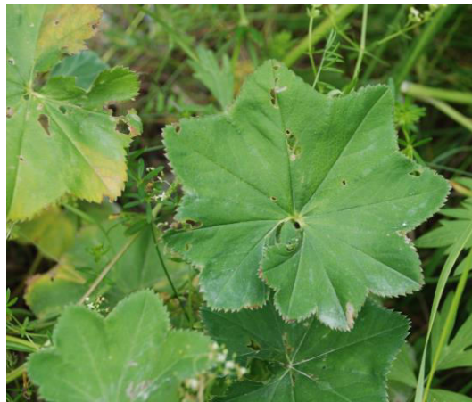
Sjuhörnig daggekåpa i Skymhyttan.