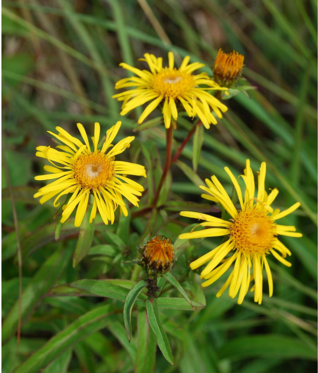
Krißla i Näsmarkerna.

Era fynd rapporterar ni som vanligt in till mig!