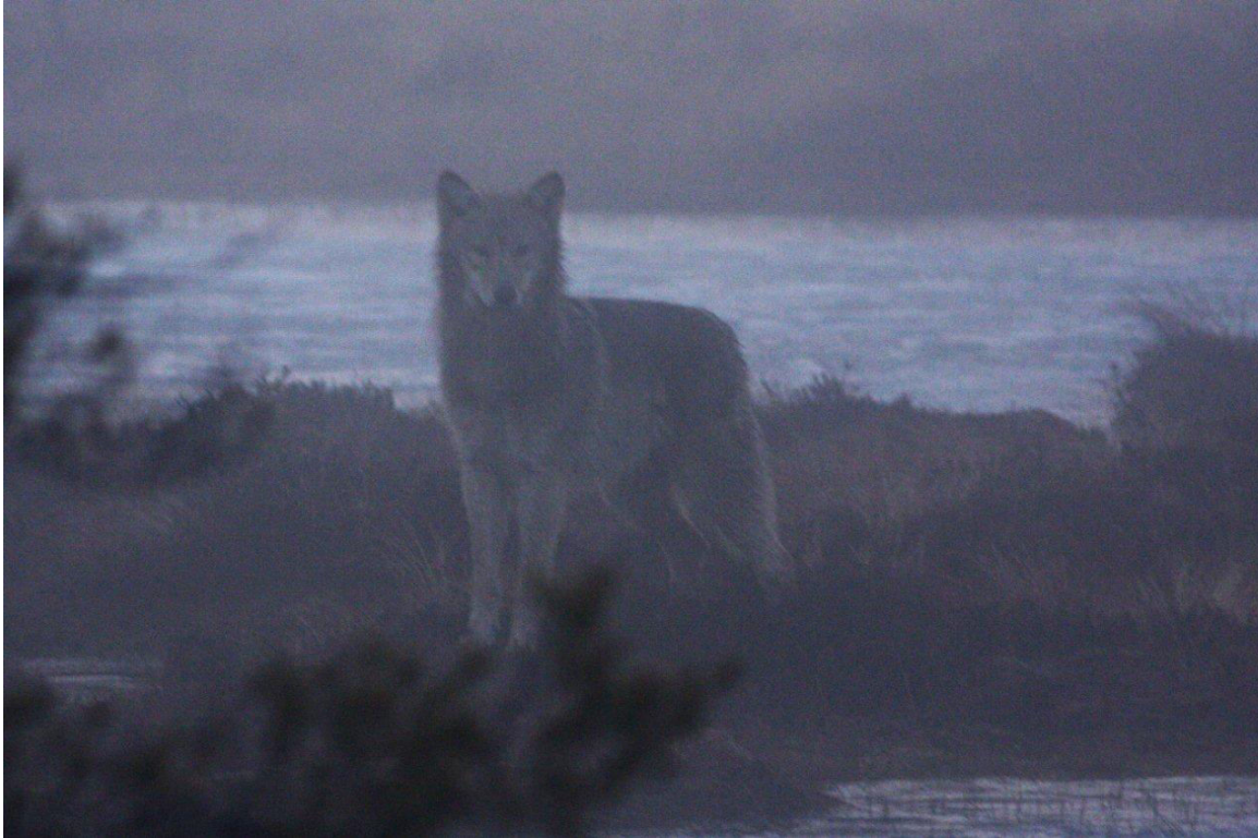
Varg på Älvamossen nära Grecksåsar april 2009.