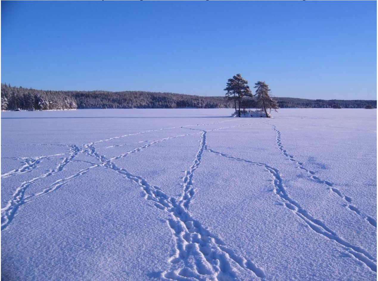
Spårlöpor från sju vargar på Bälgsjöns is december 2009.

den invandrade finsk-ryska vargen i Gävleborgs län. Han vandrade genom länet