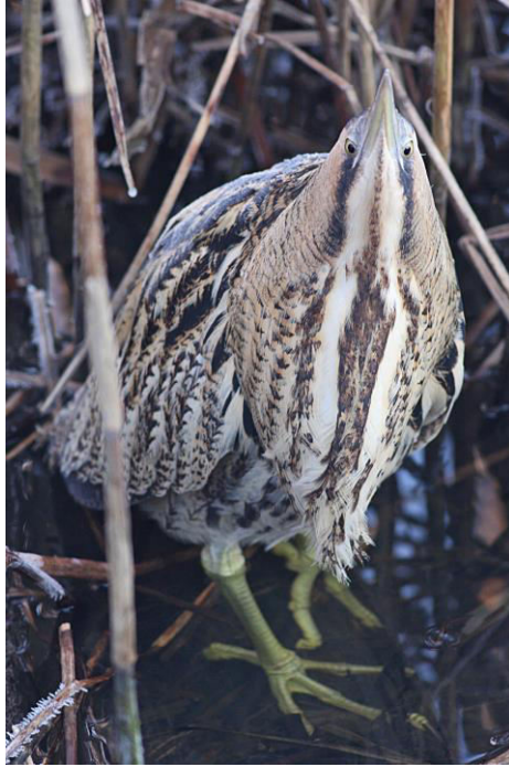
Rödrom blev en ny art i Nora kommun. Foto från Torslandaviken, Göteborg: Joakim Johansson.