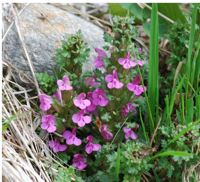
Granspira vid Röbergshagen.

Vi besökte i juni en lokal för granspira ( Pedicularis sylvestris ) i den stora kraftledningsgatan i Skymhyttan. Den fanns överraskande kvar över ganska stora ytor och gick även ut i åkermark! Genom att gatan hålls öppen genom slyröjning, har här skapats en närmast hedartad natur som verkar passa granspiran utmärkt. Här blommade säkert 1500-2000 ex.